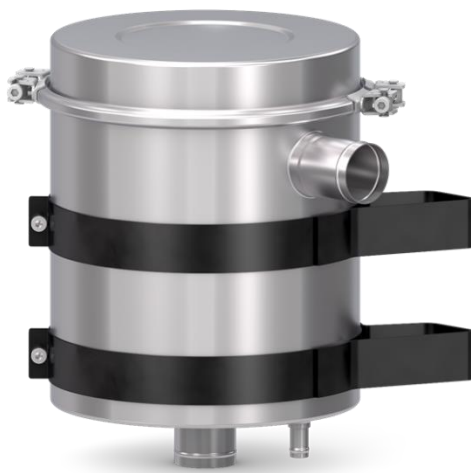
Abb. 1: ProVent 2 700 System

ProVent 2 700 Systeme sind sowohl für die Erstausrüstung als auch für die Nachrüstung konzipiert. Nachfolgende Abbildungen zeigen mögliche Aufbauten sowie ein Querschnitt des Systems.